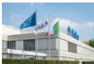
Fidia_outdoor_logo and flags