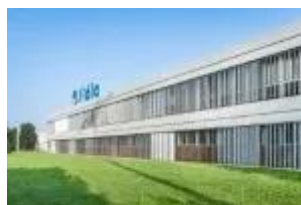
Fidia_outdoor_logo and façade